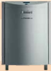
Fotos: Spanner Re 2 GmbH, Vaillant: Deutschland GmbH & Co. KG, Tuxhorn Blockheizkraftwerke GmbH